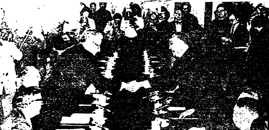
براون ونائب رئيس الحكومة الصينية سينغ - يباو يتصافحان بعد محادثتهما في بكين .

قانون التنظيم والبناء - 1965 منطقة تنظيم محلية - شمعونيم اعلان بخصوص ايداع خارطة مفصلة يعلن بهذا ، وفقا للمادة 89 من قانون التنظيم والبناء لسنة 1965 انه اودعت في مكتب اللجنة الوائبة للتنظيم والبناء والجنوب في مكتب اللجنة المحلية للتنظيم والبناء شمعونيم خارطة مفصلة «الخارطة رقم 119/27/7» مرتفة مع التخطيط . وهذه هي المساحات المشمولة في الخارطة : مساحة 2111 دونم في المنطقة الحدودية لل سبع . اهم اهداف الخارطة : تخصيص مساحات معينة لتسليم 124 منطقة ايداع خاصة ، مؤسست مية ، مساحات علمية ، طرق وحوادث . كل معنى في الخارطة بإمكانه الاطلاع عليها دون مقابل في ايام وساعات العمل . كل معنى بالارض ، بالبناء او بكل جزئياتي اخر ، ويرى نفسه متضررا من جراء تغيير الخارطة ، وايضا كل من يرضى له حسب البند 100 من القانون ، بإمكانه خلال شهرين من يوم نشر الاعلان الجديدة الرسمية ان يقدم اعتراضه الى مكتب اللجنة المحلية المذكورة . ي . - - - - - رئيس اللجنة الوائبة للتنظيم والبناء - لواء الجنوب